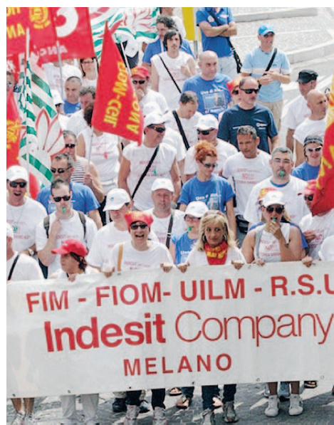
Una manifestazione dei dipendenti Indesit