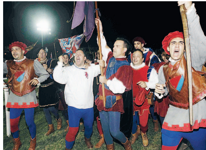
I festeggiamenti di Porta Romana allo Squarcia e nella sede di sestiere per la vittoria a sorpresa alla Quintana

fatto due tornate con grande professionalità". Capriotti cavaliere anche nell'animo: "Dopo l'urlo dei tifosi appena appreso della mia vittoria sono andato via per non esacerbare gli animi. I figuranti dei due sestieri erano seduti vicini e capisco cosa provi in quel momento chi