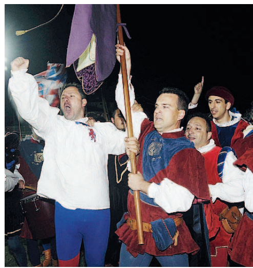
L'esultanza dei sestieranti di Porta Romana